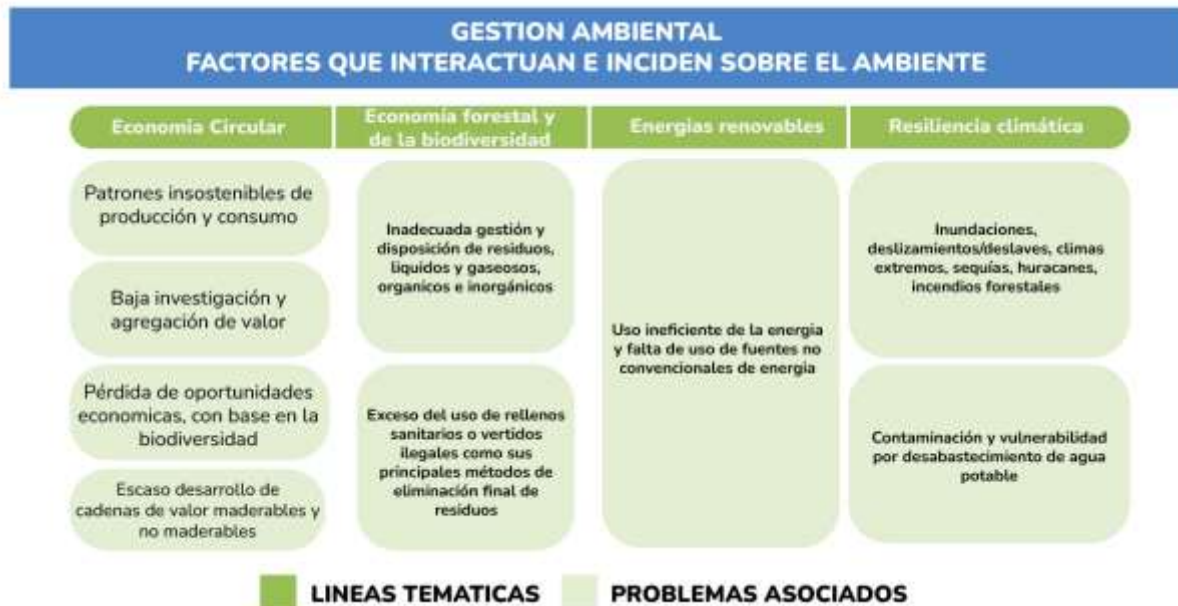
Figura 2. Problemáticas asociadas al componente de gestión ambiental.