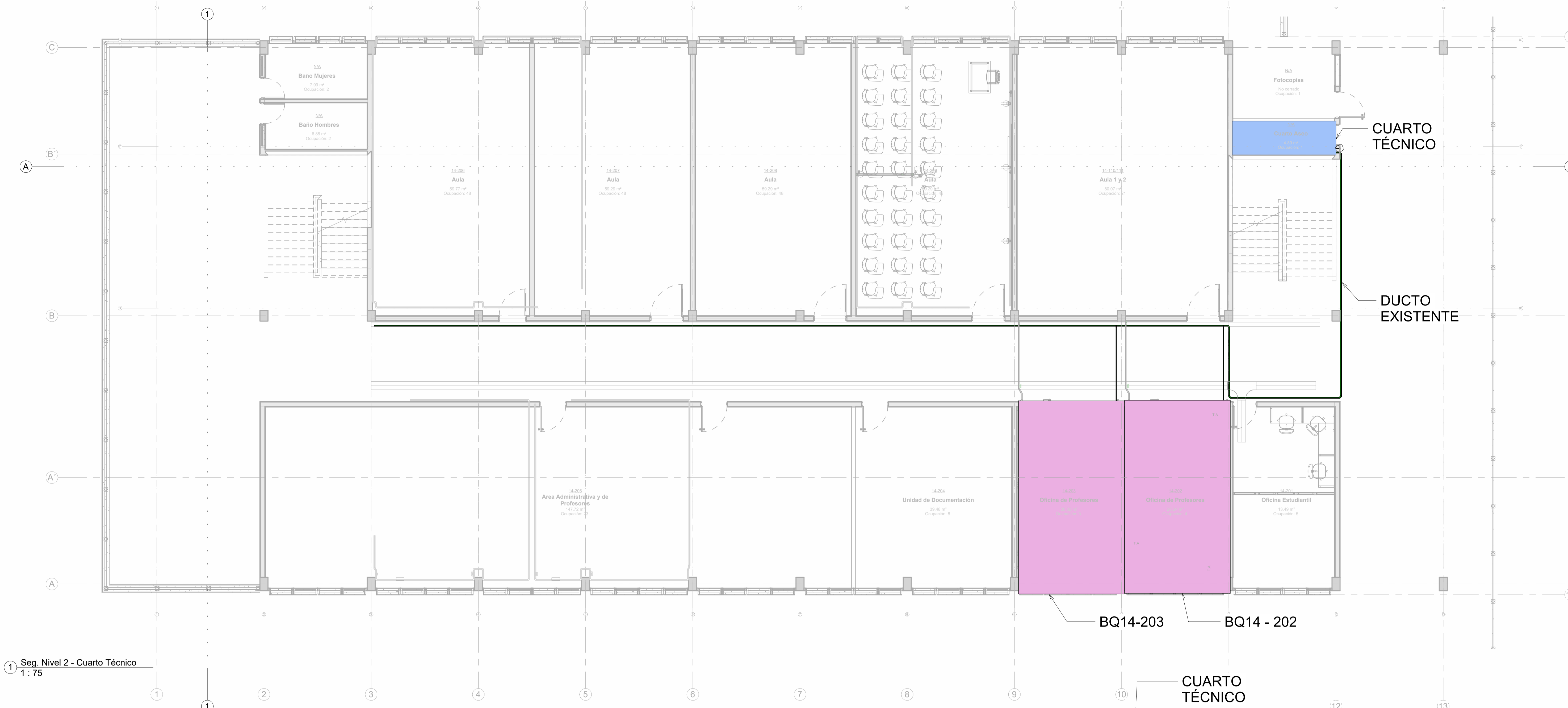
1 Seg. Nivel 2 - Cuarto Técnico 1:75