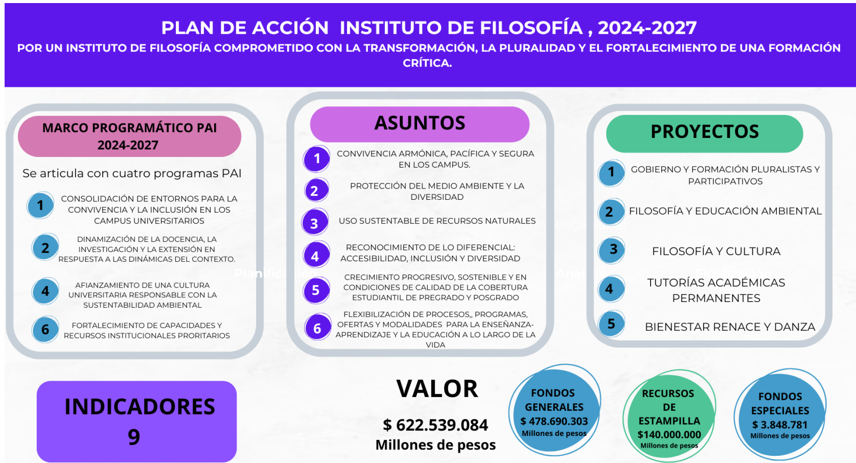
Figura 2. El Plan de Acción del Instituto de Filosofía 2024-2027 en una página.