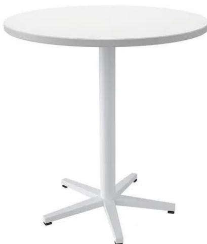
Ilustración 4. Imagen de referencia. M23

Superficie en aglomerado de 25mm o 30mm de espesor con acabado en formica apariencia madera (color a definir por la interventoría), canto plano PVC termo fundido y balance en la parte inferior, soportes y enganches metálicos, estructura en acero cold rolled calibre 16, base central con mínimo cuatro (4) apoyos. Acabado con pintura en polvo epoxi poliéster de aplicación electrostática y niveladores escualizables. (Incluye todo lo necesario para su instalación y correcto funcionamiento).