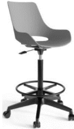
Ilustración 2. Imagen de referencia. M23

(Incluye todo lo necesario para su instalación y correcto funcionamiento).