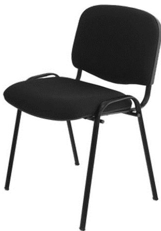
Ilustración 2. Imagen de referencia. S3

(Incluye todo lo necesario para su instalación y correcto funcionamiento).