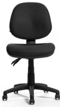
Ilustración 1. Imagen de referencia. S1