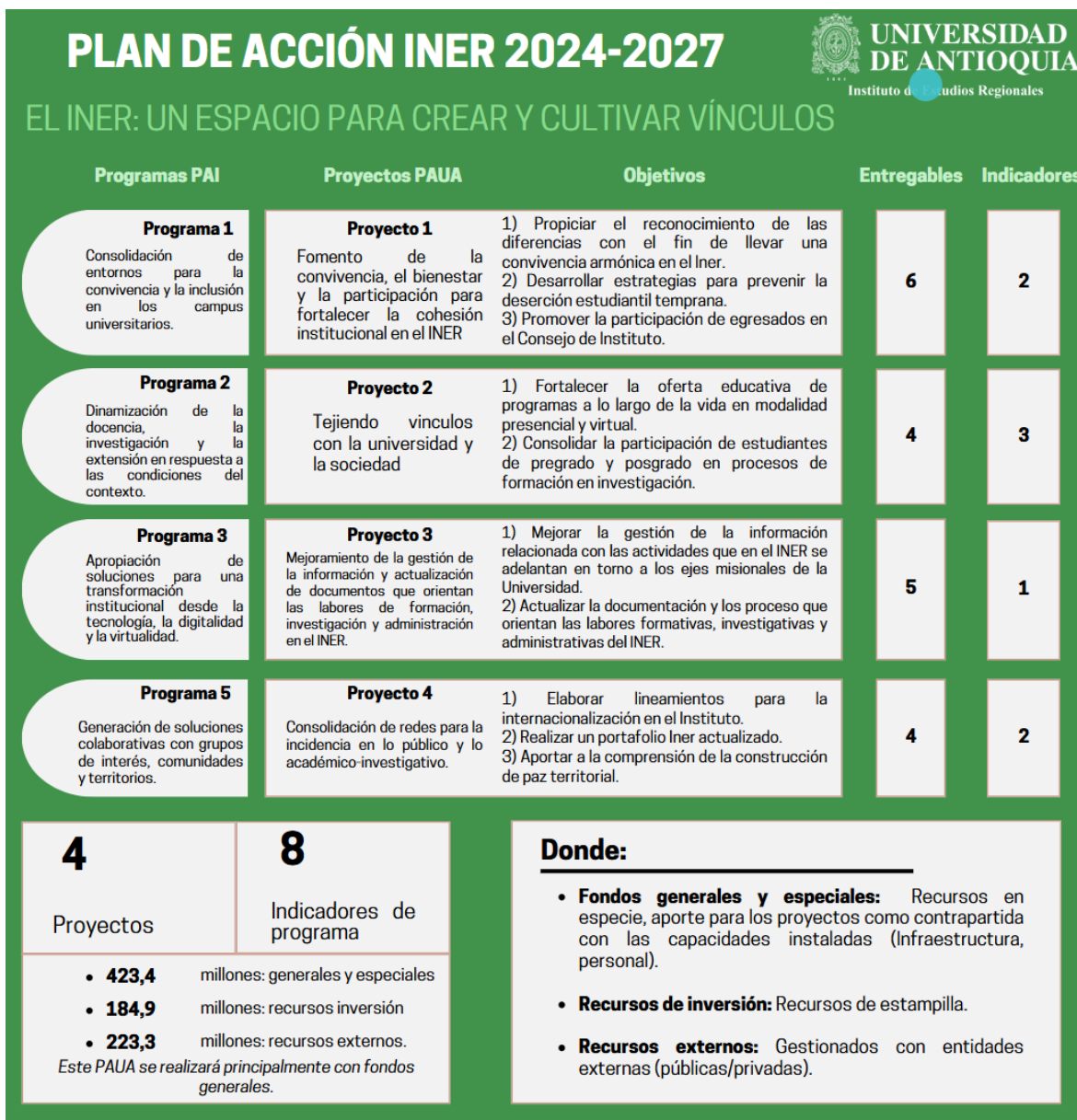
Figura 2. Plan de Acción INER 2024-2027.