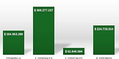
TOTAL POR FUENTES DE FINANCIACION