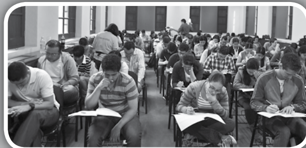
Aspirantes a programas de posgrado, durante la presentación del examen de admisión

El 18 de mayo se realizó el examen de admisión para los 37 programas de posgrado que se ofertaron este año en la Facultad. A la convocatoria se inscribieron 2.386 personas, quienes aspiraron por uno de los 154 cupos habilitados por la unidad académica en las modalidades de maestría, especializaciones médicas, clínicas y quirúrgicas.