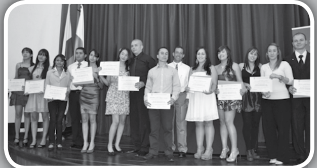
Grupo de graduandos en la tarima del Auditorio Principal

El pasado martes 22 de mayo, la Facultad graduó a 16 Técnicos Profesionales en Atención Prehospitalaria —APH—; el acto se llevó a cabo en el Auditorio Principal a las 3:00 p.m.