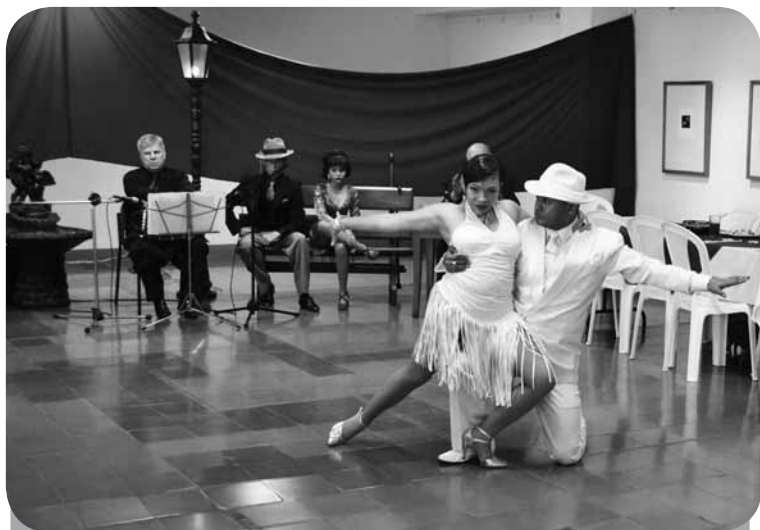
Presentación de tango que hizo parte de la celebración del Día del Maestro, realizada en la Biblioteca Médica

Además, a propósito del Día del Maestro, publicamos Obligado a... Una experiencia en el aula sobre la formación integral , escrito por uno de nuestros profesores, que presenta una situación ocurrida en el aula, así como sus apreciaciones sobre la relación médico-paciente y sobre la clase de profesores y estudiantes que se necesitan para cumplir con una verdadera formación integral.