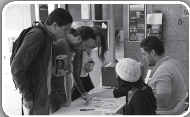
Participantes en la jornada de elección, que se desarrolló en el Hall del ascensor

Luego de la jornada de votación del pasado 9 de mayo, estas personas fueron elegidas como los nuevos representantes estudiantiles que harán parte de los distintos comités de la Facultad de Medicina.