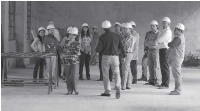
Miembros del Consejo de la Facultad durante el recorrido por las obras de la Facultad

El pasado 12 de febrero el Consejo de la Facultad visitó la obra de la tercera fase del proyecto denominado Plan Maestro de Espacios Físicos. Allí se evidenciaron grandes avances y uno de ellos hace referencia a la rehabilitación estructural de las vigas, actividad enfocada para el cumplimiento estipulado en el Reglamento colombiano de construcción sismo-resistente (NSR-10) , norma técnica colombiana que se encarga de la reglamentación de las condiciones con las que deben contar las construcciones para situaciones de sismos.