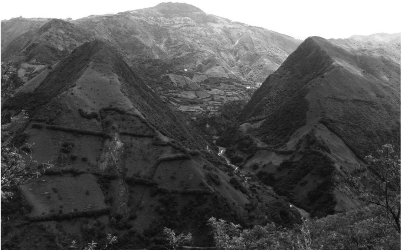
Gaia pariendo el río Arma. Foto tomada desde la mula "Pastora" el 3 de enero de 2014, en el camino hacia Sonsón.

actuar, el sentido estrogenotropocéntrico y el amor igualador. Sin embargo la visión y la misión de ésta no debe ser solamente una postura del sexo, sino que debe ser una actitud global y humana, y en ese sentido la invitación es a introducir en la práctica esos ingredientes que exaltarán el ser humano. Si nunca lo ha pensado, lo ha hecho, lo ha sentido o lo ha practicado, hágalo ahora, verá cómo el amor confundido dentro de una práctica racional, no solamente enriquece el espíritu sino la felicidad de sentirse vivo y médico, cuidando y amando.