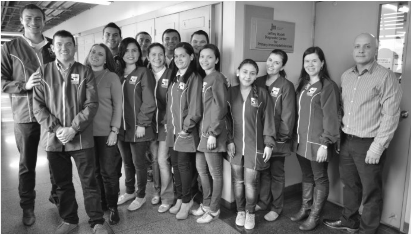
Grupo de Inmunodeficiencias Primarias, Facultad de Medicina de la Universidad de Antioquia