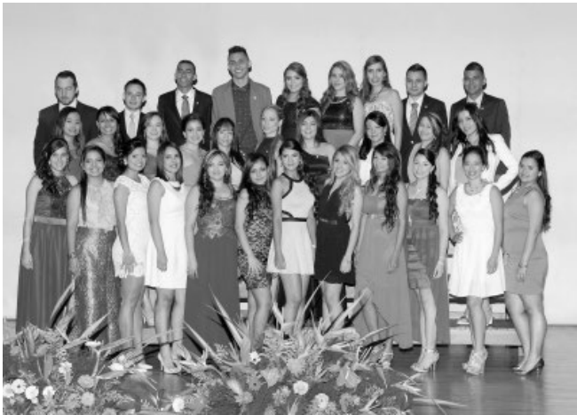
Instrumentadores Quirúrgicos, 2014-2

“Es para mí un honor dirigirme a ustedes y poder expresar el sentir en este día de gran importancia para cada uno de nosotros, porque culminamos una de las etapas más trascendentales de nuestras vidas.