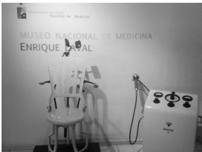
Museo Nacional de Medicina, Universidad de Chile