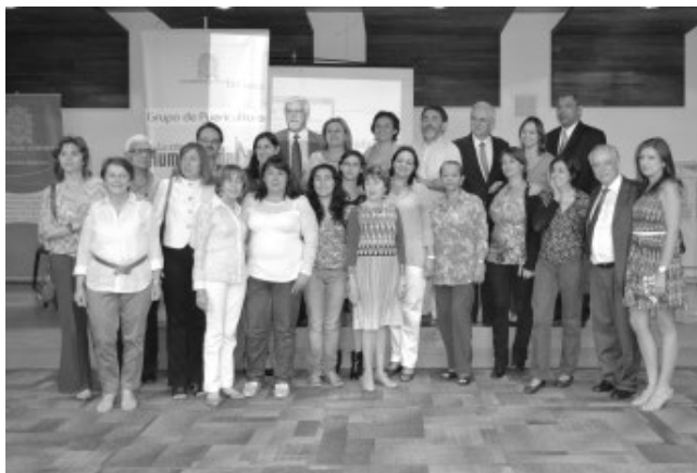
Grupo de Puericultura del Departamento de Pediatría y Puericultura de la Facultad de Medicina de la Universidad de Antioquia