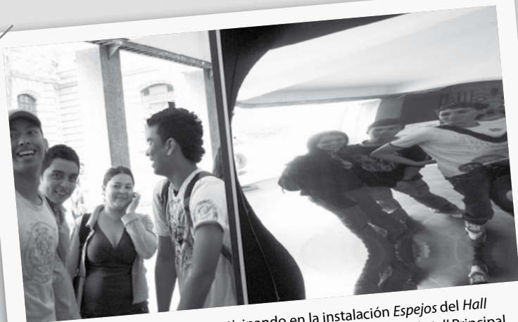
Grupo de estudiantes participando en la instalación Espejos del Hall Interactivo DiverSOS , montaje que duró toda la semana en el Hall Principal .