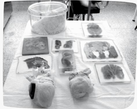
Especímenes plastinados en la Facultad de Medicina y en el Laboratorio de la Universidad de Murcia, España.

El laboratorio ha contado con espacios improvisados o transitorios para su funcionamiento; el primer espacio designado para el fin se ubicó en el cuarto piso del bloque Central de la Facultad. Allí no se efectuaron adecuaciones y se realizó el trabajo inicial con los preparados destinados a Parque Explora. Después de una serie de reformas y mantenimiento a las instalaciones del antiguo CAB Central, el espacio actual —compartido con Vía Aérea y Microneurocirugía— fue entregado en junio de 2008; con la llegada de los diferentes equipos fueron