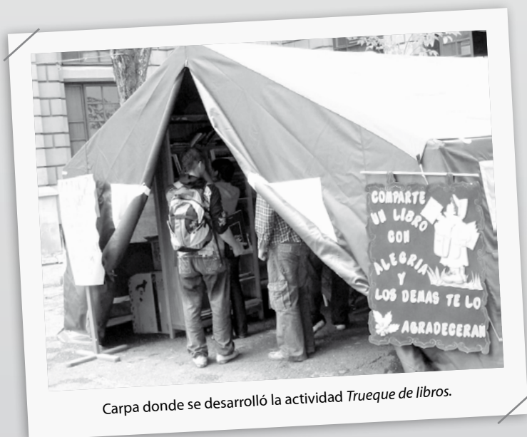
Carpa donde se desarrolló la actividad Trueque de libros .