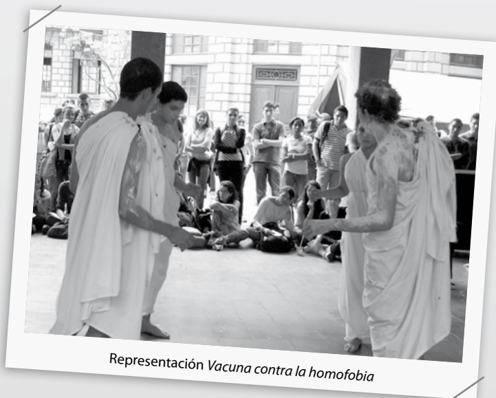
Representación Vacuna contra la homofobia