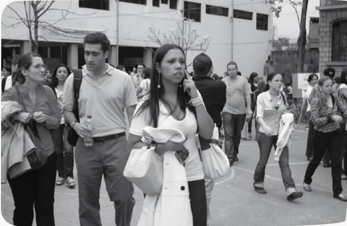
Aspirantes a los programas de posgrado, retirándose de la Facultad después de presentar el examen de admisión.