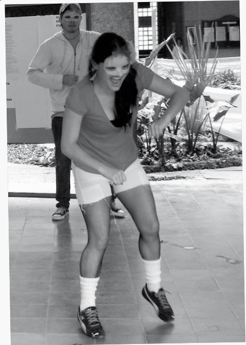
Integrante del Grupo de Danza Candamblé de la Facultad, en el montaje inspirado en el tema del amor y la muerte. Inauguración de la Semámana de la Lénguala , 2009.