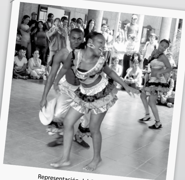
Representación del Grupo Canalete , música del pacífico colombiano