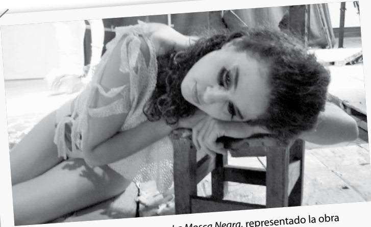
Actriz del grupo de teatro La Mosca Negra , representando la obra Rubiela Roja . Auditorio Principal de la Facultad.