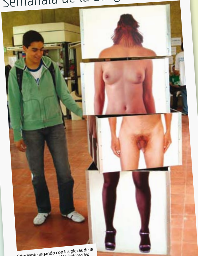
Estudiante jugando con las piezas de la instalación Corpux del Hall Interactivo DiversOS, montaje que estuvo del 20 al 24 de abril en el Hall Principal.