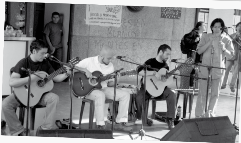
Presentación del Grupo Raza , en el Hall Principal de la Facultad