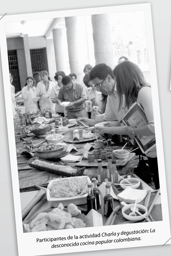
Participantes de la actividad Charla y degustación: La desconocida cocina popular colombiana .

A continuación publicamos algunas fotos de la Semánala de la Lénguala , en las cuales se pueden apreciar cómo la comunidad universitaria vivió algunas de las actividades programadas.