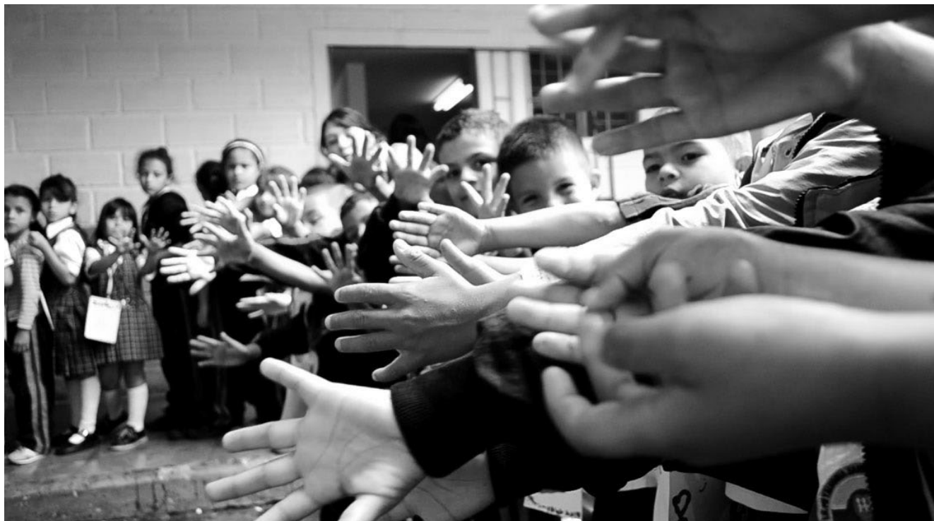
Niños de una de las instituciones educativas en las que se ha llevado a cabo el programa Del Parque a la Escuela