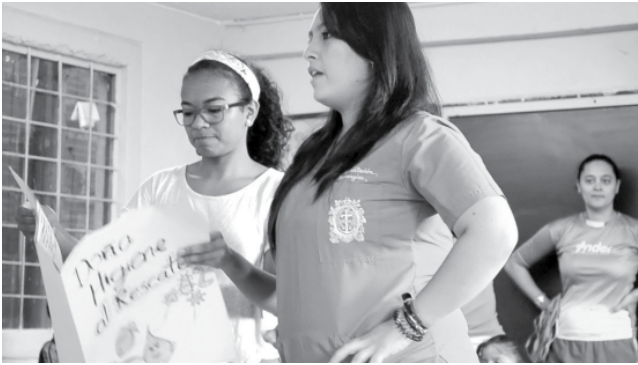
Estudiantes de Instrumentación Quirúrgica de la Facultad de Medicina en el taller sobre lavado de manos

En los talleres, que duran alrededor de dos horas, se abordan temas relacionados con el autocuidado y el cuidado del medio ambiente, en el cual la sensibilización y aprendizaje, se hacen a través de talleres con títeres y la elaboración de manualidades, así como la importancia de la actividad física y la nutrición saludable.