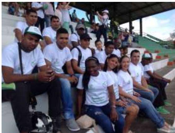
Estudiantes y egresados de la región de Urabá

En materia de Investigación , los (6) grupos del Instituto en el 2014, trabajando de manera articulada con los (7) semilleros de Investigación, han logrado una configuración académica e investigativa que ha permitido desarrollar 23 proyectos de investigación orientados a fortalecer las entidades educativas, gubernamentales y el plan de formación del Instituto. Así mismo, es significativo en materia de publicaciones, 14 artículos en revistas indexadas de la base Scienti de Colciencias.