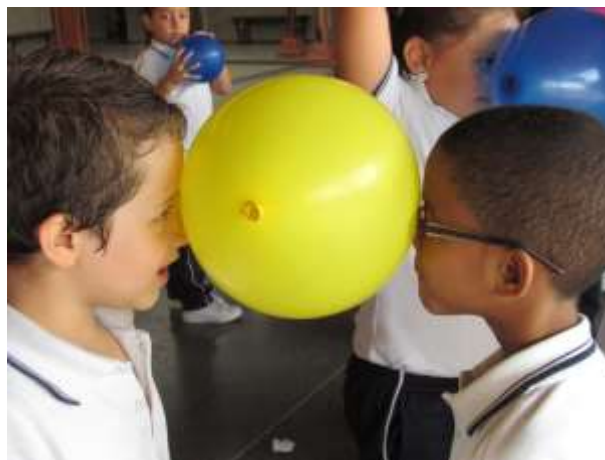
Práctica pedagógica 2014. Escenario Escolar