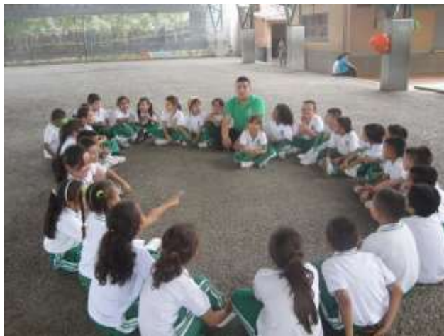
Práctica pedagógica en el escenario escolar

La relación con la comunidad se da a través de la gestión de convenios interinstitucionales con lo público y lo privado de universidades del área metropolitana, empresas, ligas, clubes, escuelas deportivas, centros culturales, fundaciones, gimnasios, entes deportivos Municipales y Departamental, hospitales y secretarías de salud Municipal, corporaciones sin ánimo de lucro, empresas de servicios públicos, así mismo algunas facultades de la Universidad de Antioquia y los programas de extensión del Instituto de Educación Física entre otros.