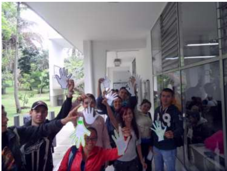
Estudiantes del IUEF en actividades recreativas

En lo que respecta al programa Profesional en Entrenamiento Deportivo, se logró graduar a los primeros dos estudiantes en este año, así mismo el programa, inició proceso de renovación del registro calificado y se inscribió a la fase inicial de acreditación de la calidad. Se pretende con base en una alta exigencia académica posicionar el pregrado en el campo del deporte asociado, donde ya se han logrado importantes reconocimientos entre algunas de las ligas más importantes del Departamento. De igual manera, con el deseo de fortalecer el ejercicio profesional de los entrenadores deportivos se ha llevado a cabo en el país la formulación de la Ley del Entrenador Deportivo en la cual el Instituto tuvo alto liderazgo al hacer parte del Comité Ejecutivo de la Asociación Red Colombiana de Facultades de Deporte, Educación Física y Recreación-ARCOFADER.