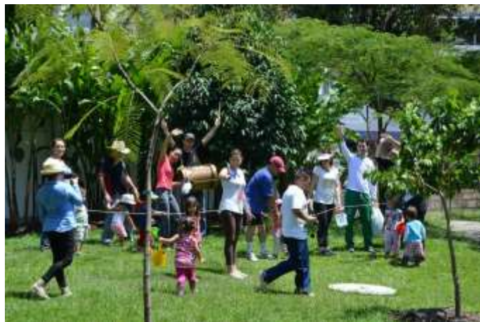
Programa Crecer en Familia

Otros resultados y efectos obtenidos con los programas llevados a cabo en el 2014, fueron la inclusión de los padres de familia, la cualificación de monitores, la inclusión de las personas en situación de discapacidad, la asesoría, el acompañamiento, la asistencia técnica, la formación, cualificación e integración regional y la contribución al desarrollo académico-investigativo de la región.