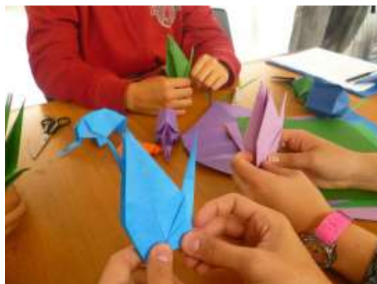
Actividades artísticas y culturales

formación de líderes, oferta de programas en Actividad Física y Salud para la comunidad interna y para la externa a bajo costo.