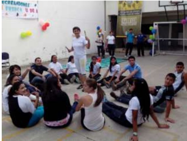
Expomotricidad Nordeste – Grupo de estudiantes Lic. Educación Física. Sede Nordeste.

En la región del Urabá a su vez, inició la formulación del proyecto académico, Centro Superior de Formación Deportiva en articulación con la Gobernación de Antioquia, Indeportes, la Dirección de Regionalización de la Universidad, el Politécnico Colombiano “Jaime Isaza Cadavid” y el Sena, el cual será implementado próximamente en el municipio de Chigorodó.