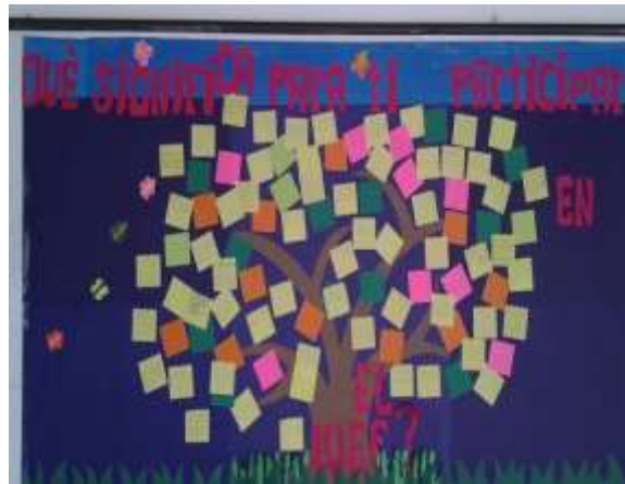
Actividad de participación realizada con estudiantes del IUEF

Se implementó durante el año 2014, una estrategia transversal a todas las acciones y dinámicas de la unidad académica direccionadas al propósito de fomentar la formación política. La estrategia fue configurada alrededor de cuatro categorías: "información, participación, re-significación y construcción", obteniendo unos resultados bastante significativos en el acercamiento a los distintos actores de la comunidad académica en Medellín y las regiones.