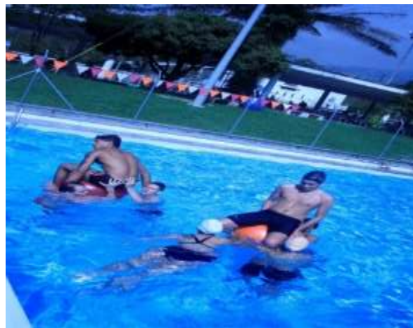
Estudiantes en actividades de Bienestar

En los programas de bienestar ofertados directamente por la dependencia en el año sobresale la diversidad de los mismos y la amplia cobertura en lo que se destaca el beneficio directo a los empleados, docentes y egresados del Instituto, igualmente se benefician de manera significativa los empleados, docentes y administrativos de Ciudadela Robledo y de otras unidades académicas de la universidad.