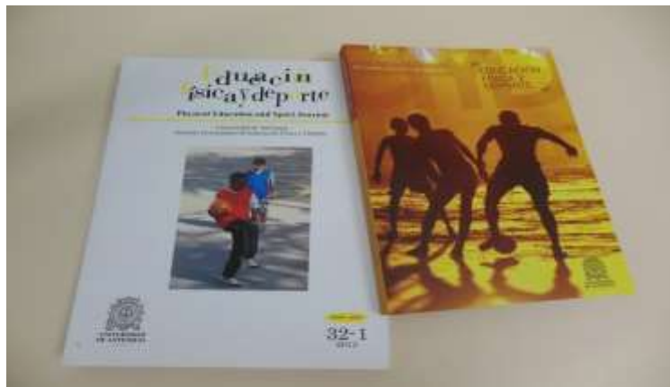
Revistas Educación física y deporte publicadas en el año 2014

En materia de publicaciones se resaltan los 35 años de existencia de la Revista Educación Física y Deporte , la cual se presentó al Sistema Nacional de Indexación para una nueva clasificación en el índice de Publindex, a su vez, acaba de ser admitida en Scientific Electronic Library Online SciELO Colombia, una de las más importantes bibliotecas virtuales que cubre una colección selecta de revistas científicas colombianas de todas las áreas del conocimiento y da visibilidad de las publicaciones científicas colombianas. La revista es considerada uno de los principales referentes académicos y científicos especializados para el campo profesional en el país.