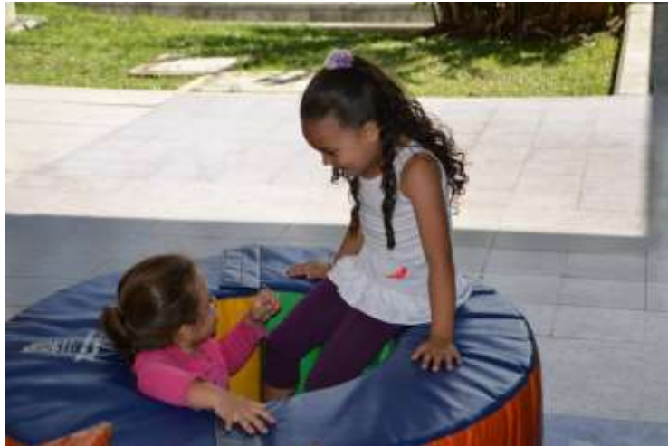
Programa Crecer en Familia

Otros resultados y efectos obtenidos con los programas llevados a cabo en el 2014, fueron la inclusión de los padres de familia, la cualificación de monitores, la inclusión de las personas en situación de discapacidad, la asesoría, el acompañamiento, la asistencia técnica, la formación, cualificación e integración regional y la contribución al desarrollo académico-investigativo de la región.