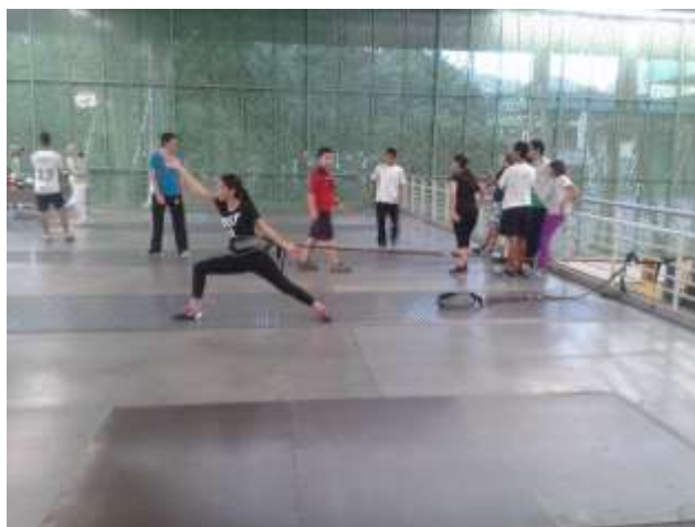
Estudiante del programa Entrenamiento Deportivo como preparador físico en la Liga de Esgrima

En lo que respecta al programa Profesional en Entrenamiento Deportivo, se logró graduar a los primeros dos estudiantes en este año, así mismo el programa, inició proceso de renovación del registro calificado y se inscribió a la fase inicial de acreditación de la calidad. Se pretende con base en una alta exigencia académica posicionar el pregrado en el campo del deporte asociado, donde ya se han logrado importantes reconocimientos entre algunas de las ligas más importantes del Departamento. De igual manera, con el deseo de fortalecer el ejercicio profesional de los entrenadores deportivos se ha llevado a cabo en el país la formulación de la Ley del Entrenador Deportivo en la cual el Instituto tuvo alto liderazgo al hacer parte del Comité Ejecutivo de la Asociación Red Colombiana de Facultades de Deporte, Educación Física y Recreación-ARCOFADER.